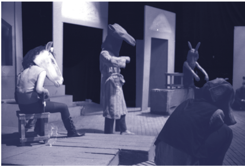
Shahr-e Ghesseh © Nasib Naasib