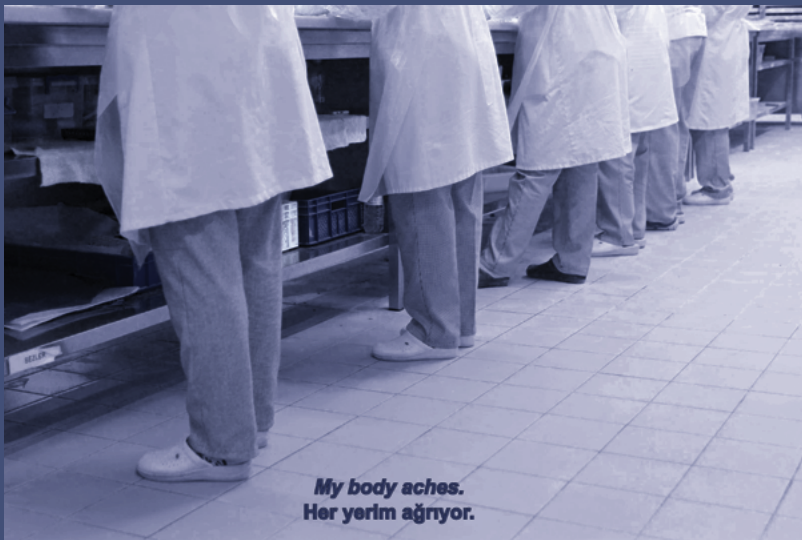
A Horn That Swallows Songs, video still