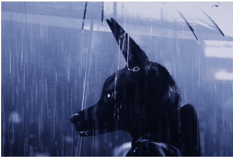
Bouchra, video still