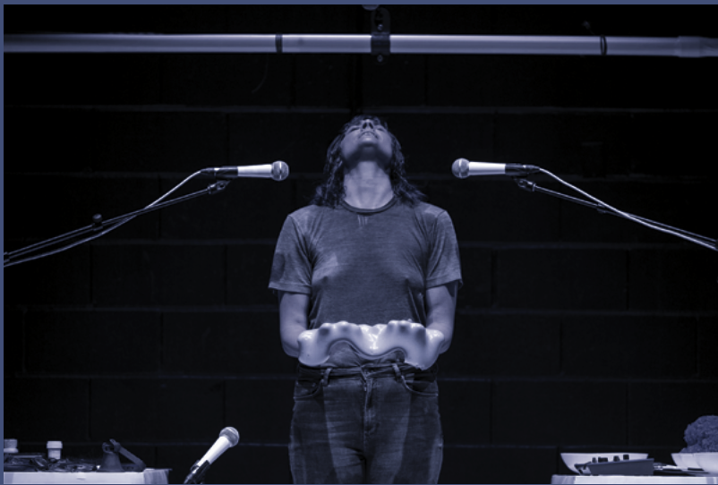
Thank You For Coming: Space