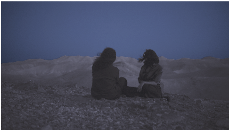
Prisoners of Love: Until the Sun of Freedom, video still