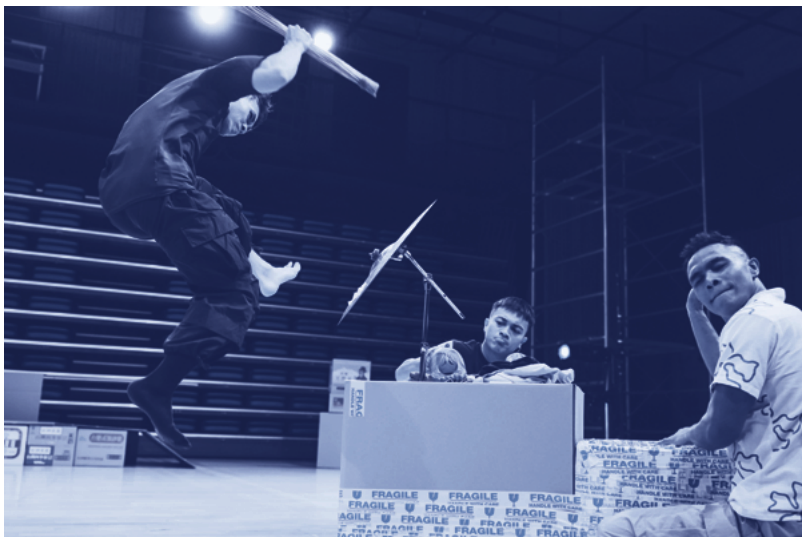
© Basir Yang & Miller, Tainan Arts Festival 2025