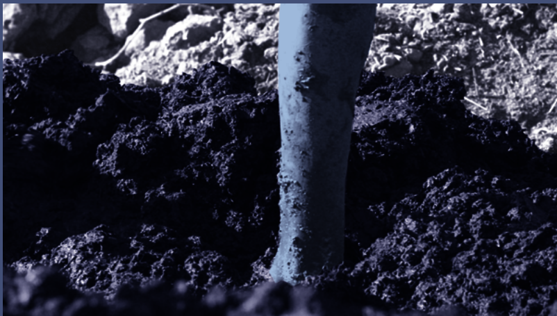
Video still from Of Men and Gods and Mud , 2022.