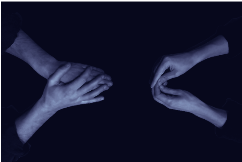
© Silke Huysmans & Hannes Dereere